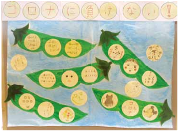
展示作品「コロナに負けない！」

入居者のみなさんとコロナウイルス感染症の終息を願って展示作品作りをしました。えんどう豆の中に願いやかわいいイラストが描いてあり気持ちが和みます。