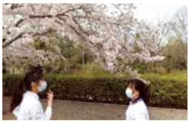
外国人技能実習生 「桜見て何思ふ」