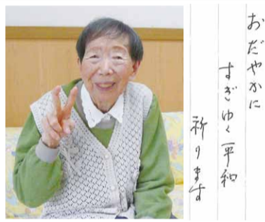
おだやかにすきゆく平和祈ります