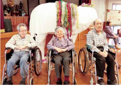
白象の前で記念写真