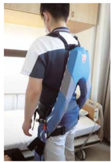
マッスルスーツ。介護負担軽減で腰痛予防。