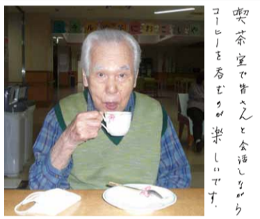
喫茶室や皆へんと全活しりやうコーヒーを飲むのが楽しいです。