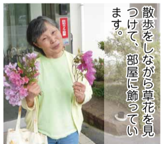
散歩をしながら草花を見つけて、部屋に飾っています。