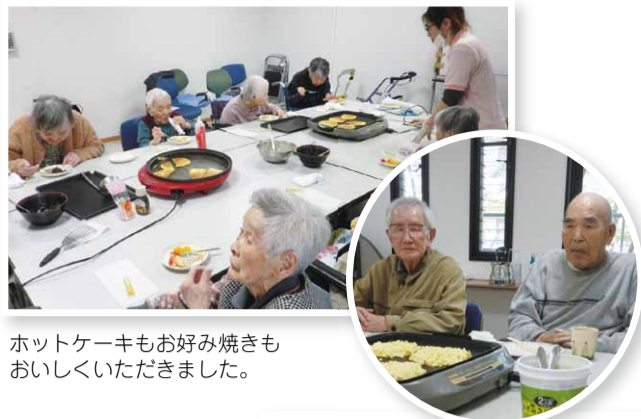
ホットケーキもお好み焼きもおいしくいただきました。