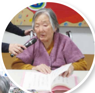
ちょっと歌ってみようか。