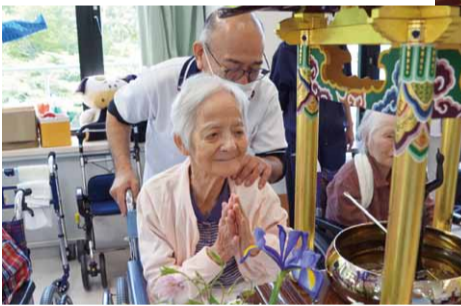
いつもみんなと一緒に楽しく元気に過ごしています