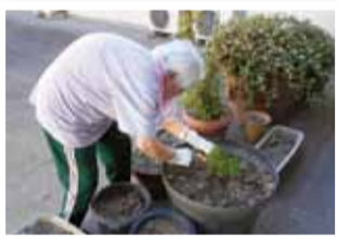
皇帝ダリアを植えています！