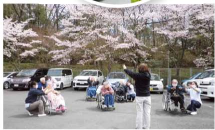
きれいな園庭の桜に気分も華やきます。