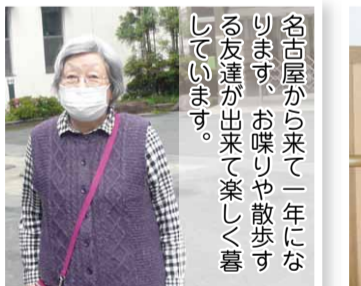
名古屋から来て一年になります。お喋りや散歩する友達が出来る楽しく暮らしています。