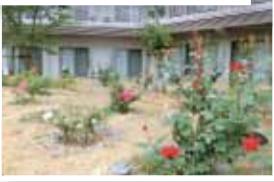
今年はきれいにたくさん花を付けました。