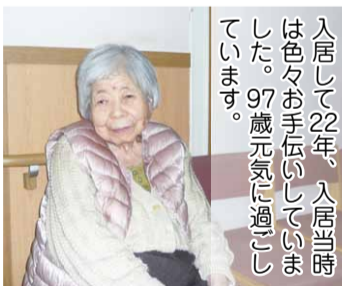
入居して22年、入居当時は色々お手伝いしていました。97歳元気に過ごしています。