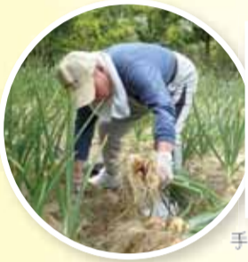
手際良く玉ねぎ収穫