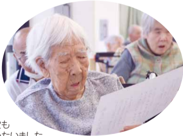
花まつりの歌も 大きな声でうたいました

亀岡園 今年の花まつりでは、ご利用者をユニット毎に少人数ずつ、神の化身である白象に、花御堂と生誕仏が用意されたホールにご案内しました。早速生誕仏に甘茶を掛け、お祈りして頂いた後は、甘茶に舌つづみ。立派な白象に感心されながら、甘茶の感想や、生誕仏の可愛らしいお釈迦様の事、はたまた昔に参加された花まつりの思い出話等…。和やかな雰囲気の中で、皆さんのおもしろいおもしろい形で、今年の花まつりを楽しんで頂きました。