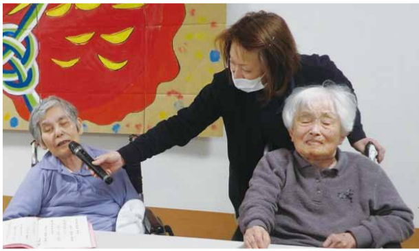
マイクを向けると大きい声が出ます。ウマイ！