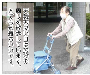
天気の良い日は施設の周りを散歩しています。とても気持ちいいです。