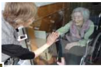
ガラス越しでハイタッチ