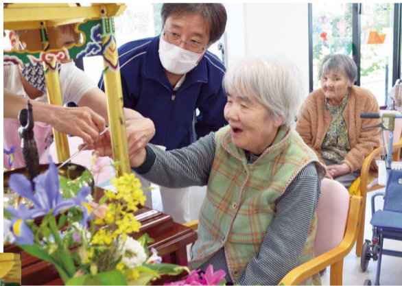
お釈迦様のお誕生日・ありがとうの心をこめて

亀岡園 今年の花まつりでは、ご利用者をユニット毎に少人数ずつ、神の化身である白象に、花御堂と生誕仏が用意されたホールにご案内しました。早速生誕仏に甘茶を掛け、お祈りして頂いた後は、甘茶に舌つづみ。立派な白象に感心されながら、甘茶の感想や、生誕仏の可愛らしいお釈迦様の事、はたまた昔に参加された花まつりの思い出話等…。和やかな雰囲気の中で、皆さんのおもしろいおもしろい形で、今年の花まつりを楽しんで頂きました。