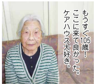
もうすぐ105歳！ここにきて良かった。ケアハウス大好き。

第二亀岡園ケアハウスは、安全・安心な生活空間で全室南向きのお部屋です。中庭から見える景色は、春は桜、秋は紅葉と四季折々を目で楽しめます。今年も、新型コロナウイルスの影響で緊急事態宣言が発令となり、行事や外出、面会を中止させて頂き、当初、ご利用者からは「嫁や孫は元気にしてるかなあ。」と会えない家族の心配をされたり、「買い物に行つて好きなお菓子食べたいな。」等、様々な声が出ていました。今ではその声が「こんな時だからこそ、自分たちが健康で楽しく過ごしている事で家族が安心し、喜んでくれる」という思いに変わられ、それぞれの生活スタイルで日々の生活を生き生きと楽しんでおられます。