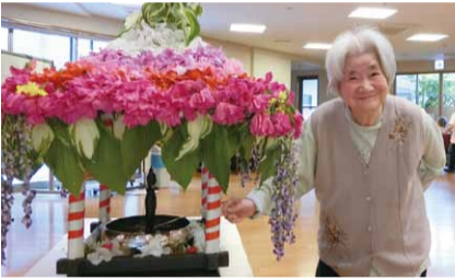
いつもの良い笑顔