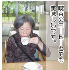
喫茶のコーヒーとても美味しいです。