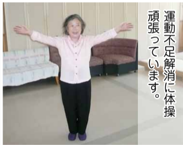
運動不足解消に体操頑張っています。