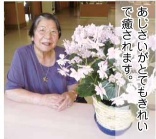
あじさいがとでもきれいで癒されます。