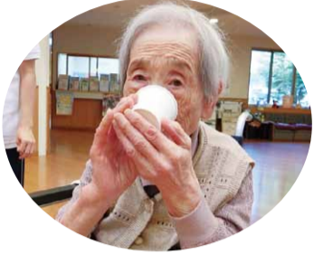
おいしい甘茶 なつかしい味