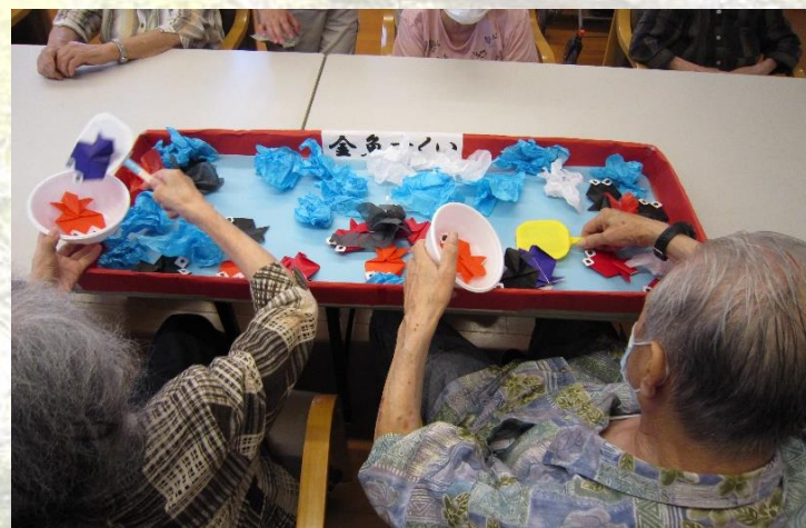
馴染みのある金魚すくい。色も賑やか、皆さんも賑やか。たくさんすくえたよ。