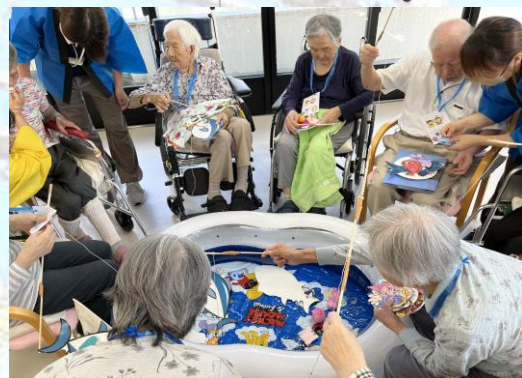
夏まつりを開催。魚釣りコーナーでは、大きな魚や小さい魚を釣り放題。たまに逃げる魚もいて、「あっ、おいしい〜」の声。