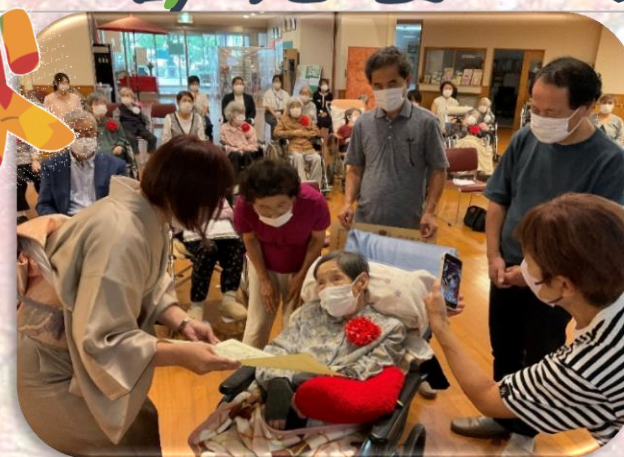
「敬老祝賀会」 新100歳の方を始め、白寿・米寿・喜寿の方々と一緒に皆さんお祝をしました。