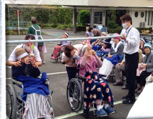
・毎年、熱くなるパン喰い競争！！応援の声も耳に入らないほど必死な瞬間です。 ・ほどいた反物を順番に巻いていきます。紅組クルクル、白組クルクル

『サンガスタジアム』皆さんはもう行かれましたか？ 9月3日の日曜日に“おしごと体験かめザニア”というイベントが開催され、利生会も福祉の体験ブースとして参加させて頂きました。色々な催し、屋台などもあって楽しかったですよ〜♪ 本当に多くの家族連れの方々が来場され、車椅子・電動リフト車・癒しのぬいぐるみなどをフリースペースで体験していただく事が出来ました。 福祉を身近に感じていただければと言う当初の目的は十二分に達成できたのではないかと、参加したメンバーも熱く心に残る思い出となりました。