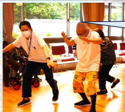
盆踊りの練習中！あれ？どうやったっけ？