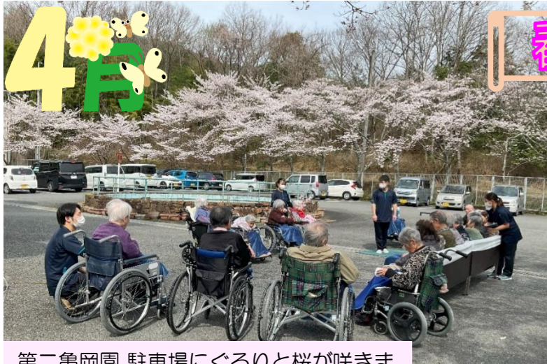
第二亀岡園 駐車場にぐるりと桜が咲きました。桜を見ながら皆でレクリエーションも楽しみました。