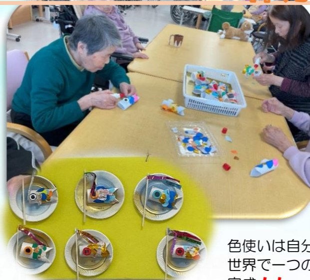
色使いは自分流。世界で一つの鯉のぼり完成!!!