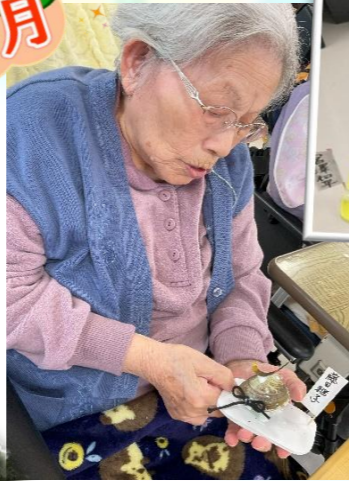
うまくハマグリの貝がらを使って、たくましくもあり、上品なかぶとの出来上がり!!!