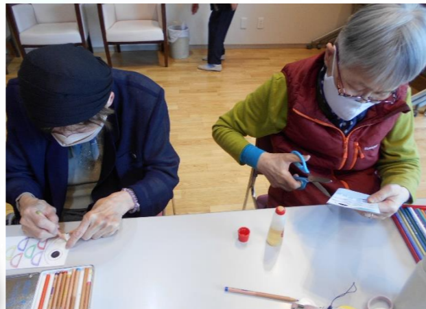
個性あふれる鯉のぼりができました。