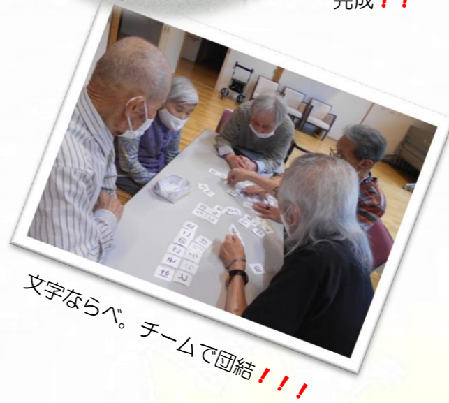
文字ならべ。チームで団結!!!